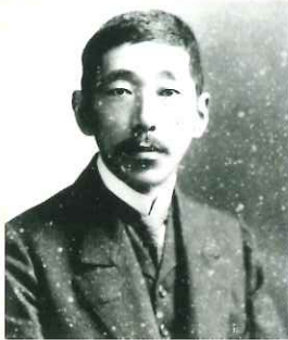
寺田寅彦肖像写真(39歳)