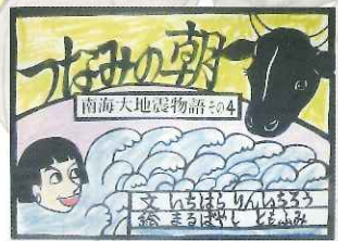
紙芝居「つなみの朝」(文/市原麟一郎 絵/丸林友文)