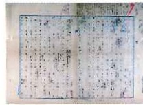
◎寺田寅彦「石油ランプ」原稿(当館蔵) ◎小宮登陸あて寺田寅彦はがき(大正12年10月20日) (みやこ町歴史民俗博物館蔵)