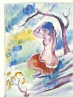
水彩画「樹下ヌード」 作成年月日不詳