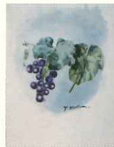
水彩画「ぶどう」 作成年月日不詳