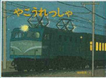
西村繁男 作・絵 / 福音館書店 / 1983