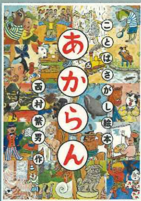
西村繁男 作・絵 / 福音館書店 / 2017