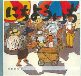
西村繁男 作・絵 / 童心社 / 1979