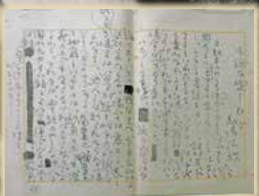
馬場孤蝶筆「手紙を楽しむ心」原稿