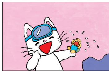
「ノンタンおよくのだいすき」