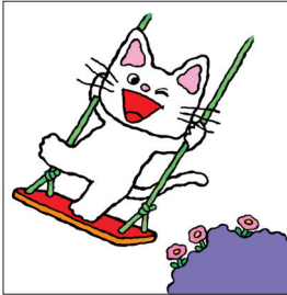
「ノンタンぶらんこのせて」