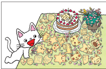
「ノンタンのたんじょうび」