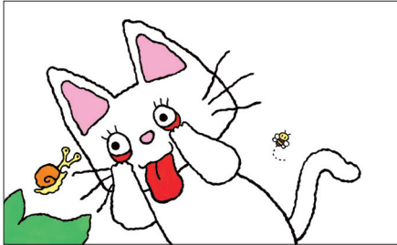
「あかんべノンタン」

この展覧会では、「ノンタン」シリーズの絵本原画、ラフや下書きをはじめ、ノンタン誕生の裏話や、ノンタンに込められた作者の想いなども紹介し、世代を超えて愛される「ノンタン」の魅力にせまります。また、高知会場では「ノンタン」絵本の世界にはいって遊ぶことができるしかけをたくさんご用意しました。子どもも大人もノンタンと一緒に遊びませんか。