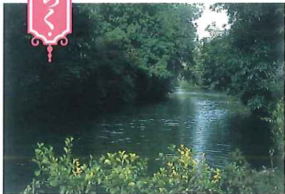
▲アイシス川(テムズ川) この川で舟遊び中にアリスの物語がうまれた

作者ルイス・キャロルの年表、物語の歴史背景や出版にいたる経緯、英国の各地に点在するゆかりの地を紹介します。