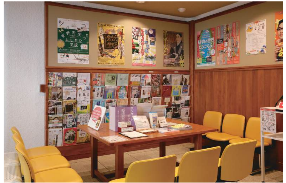
きゆうけい かい 休憩コーナー（1階）