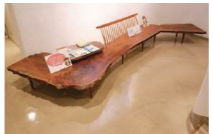
かい あ かいだん おど ば 2階へ上がる階段の踊り場

ほか 他にも、さまざまな場所にある すわ やす いすに座って 休むことができます。