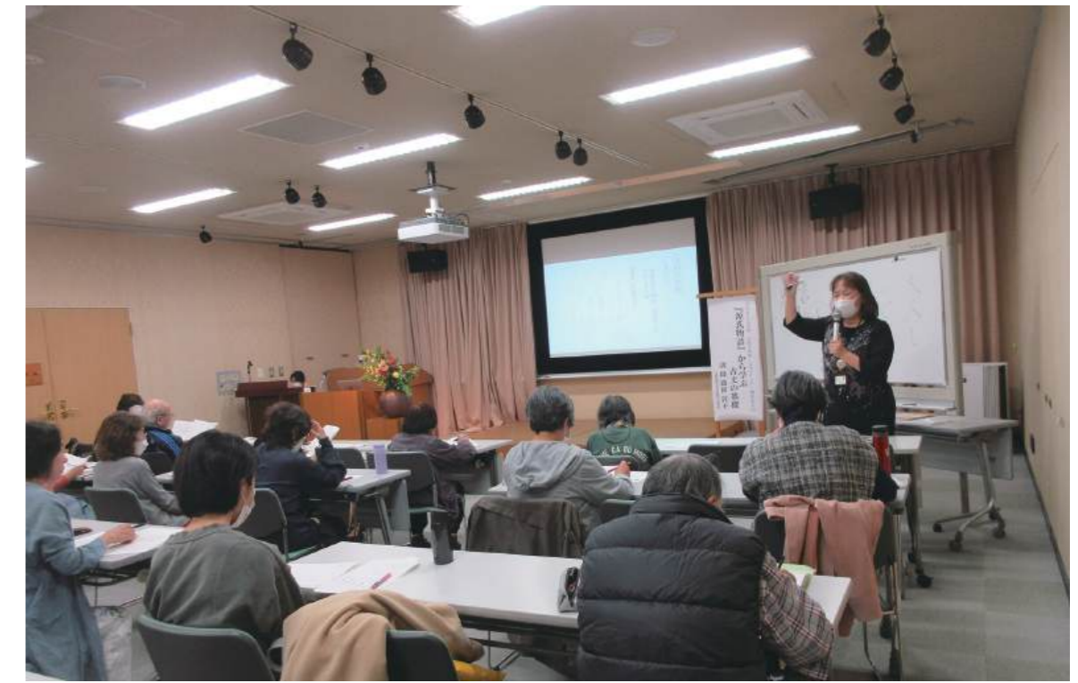
ぶんがくかん かい 文学館ホール（1階）