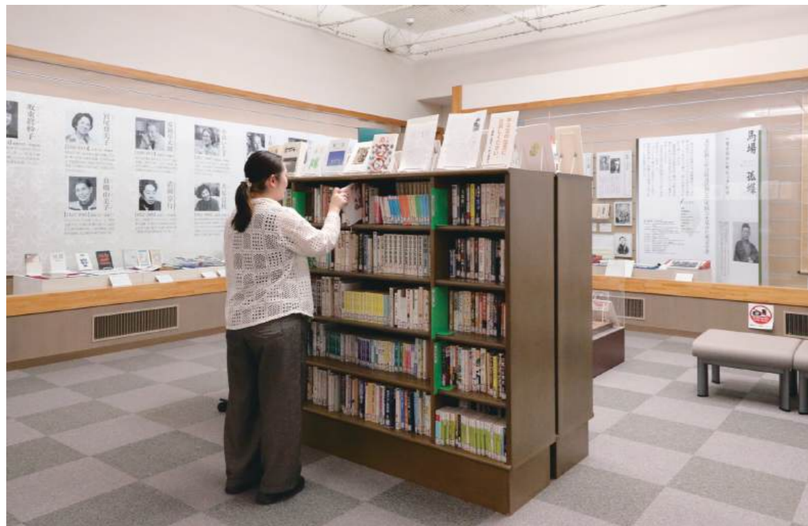
じょうせつてんじしつ かい 常設展示室 (2階)