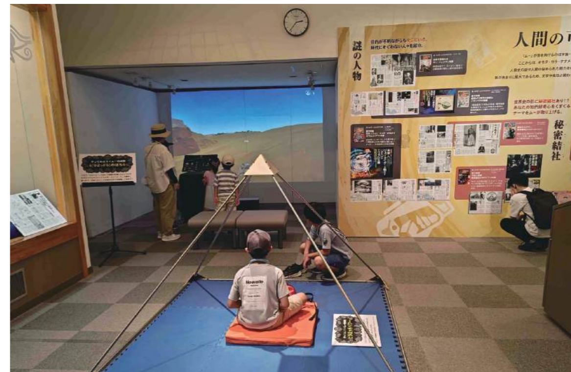
ねん かいさい てん ようす 2024年に開催した「ムー展」の様子

きかくてんじしつ たいけん たの 「企画展示室」では、「体験コーナー」で 楽しむことも できます。