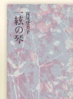
直木賞受賞作『一絃の琴』 ／昭和53年講談社刊