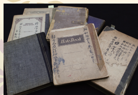
初期作品の貴重な資料「猛吾日記」