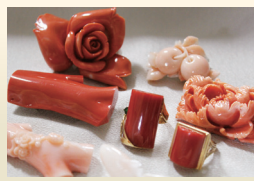
愛用のさんごの品々