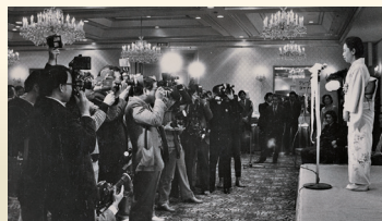
昭和54年 第80回直木賞贈呈式の様子